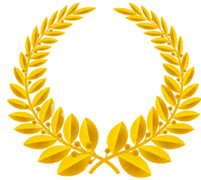
TABLEAU D'HONNEUR 2024 DES 7 DEFIS CAPITAUX