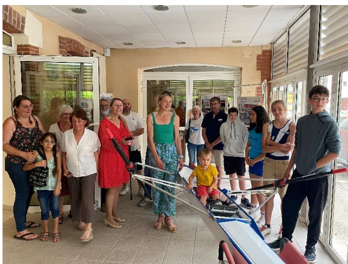
✚ L'exposition « 20 ans du club » à Châteauneuf-du-Rhône