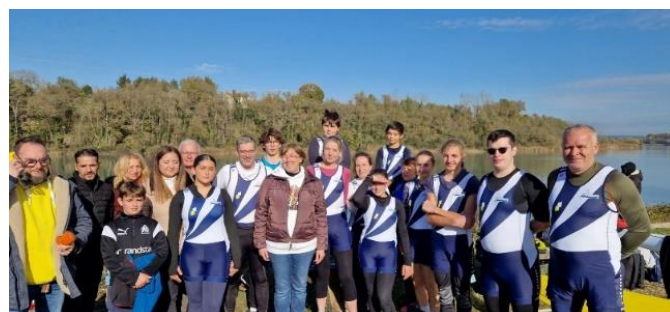
✚ Suivie d'un nouveau comité directeur Le 13 novembre