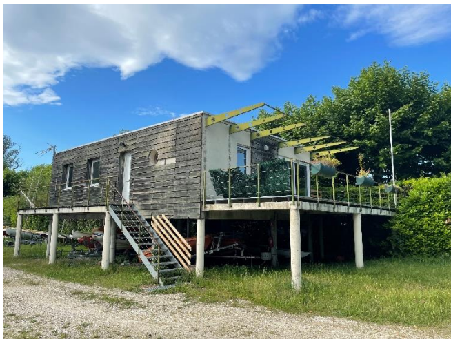
Vue de l'extérieur

Le 12 avril dernier, la municipalité de Viviers nous remettait les clefs de l'ancien logement du gardien qui est attribué aux trois associations occupant la base nautique. Ce local est à usage administratif exclusif.