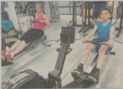
Le plus jeune de l'équipe à côté de la championne