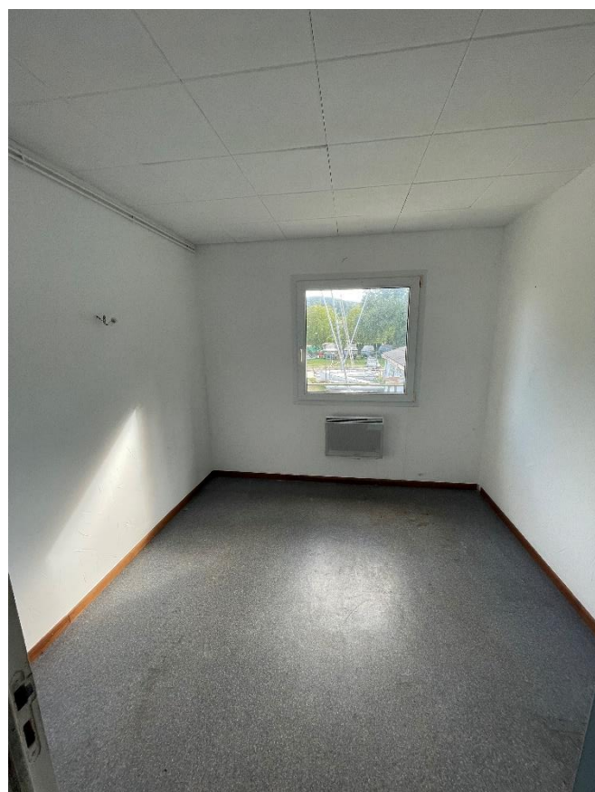
La pièce qui nous a été attribuée pour y installer notre bureau