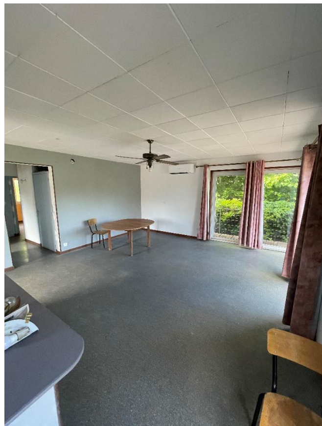
La même salle vue sous un angle différent