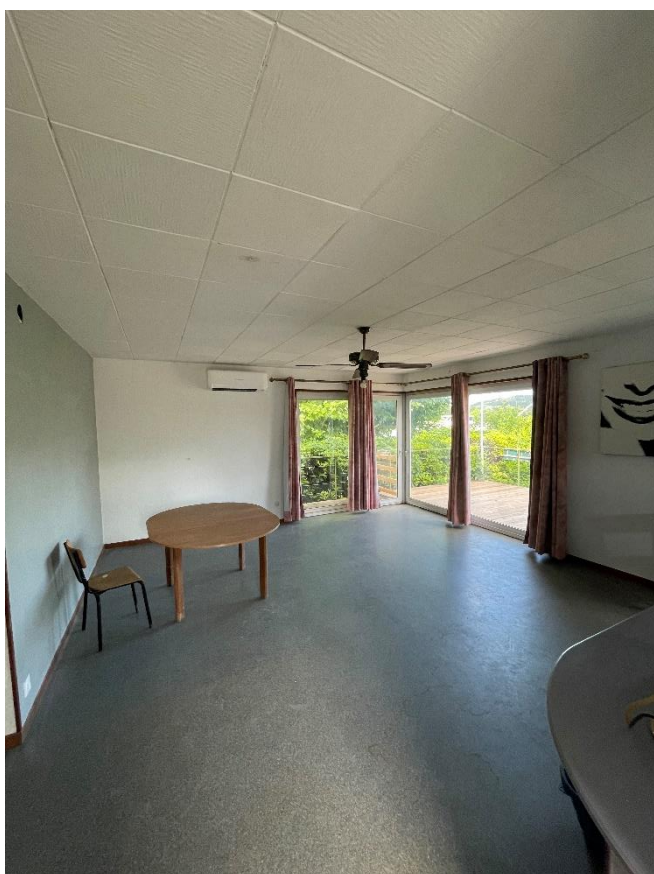
En entrant, la grande salle qui nous servira ainsi qu'à la voile et au motonautisme, de salle de réunion.